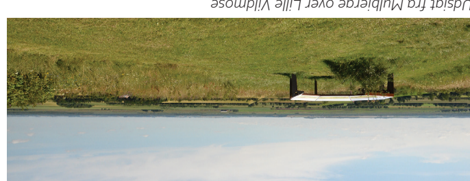
Udsigt fra Mulbjerg over Lille Vildmose

Udgivet i 2022 - Forsidefoto: Frans Ritter