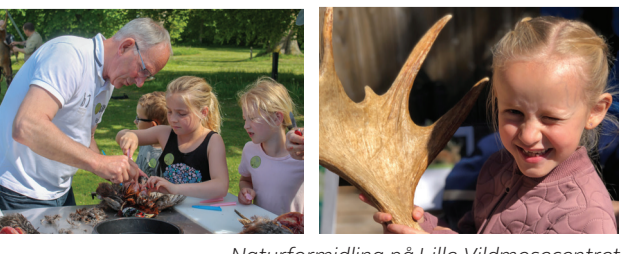
Naturformidling på Lille Vildmosecentret

0 Tofte Skov og Mose er en kronjuvel i dansk natur. I foråret 2021 blev der udsat 10 visenter (europæisk bison) i skoven, som de deler med skovens bestående på ca. 400 krondyr og ca. 100 vildsvin samt ynglende hav- og kongørner.