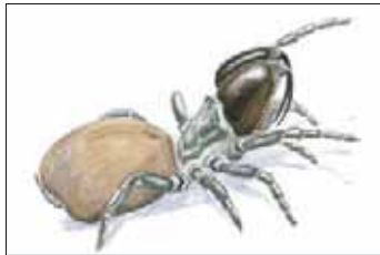
Nordlige fugleedderkop - Atypus affinis

En specialitet for området er den sjældne fugleedderkop, der i Linddalene har en af sine nordligste forekomster i Europa! Du kan lede efter arten på de tørre og solbeskinnede skråninger.