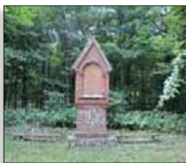
Mindemærket på Duehøj

Med en afstikker fra ruten til Duehøj kan du sætte dig og nyde et glimt af fjorden ved mindemærket. Det er rejst for kaptajn