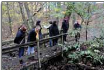
Bro over bækken

Gør du ophold på broen, så nyd et øjeblik vandets rislen. Her på de øvre skrænter løber vandet stærkt og graver sig ned i skovbunden og får med sin hvirvlen vandløbet til at sno sig. Vandet bliver derved iltet godt på vej mod fjorden. Når du igen krydser vandløbet tæt på fjorden, så har det skiftet karakter - her breder det sig ud og løber langsomt og lydløst. Sportsfiskerne og kommunen har fjernet spærringer og udlagt grus for at forbedre fiskenes mulighed for at svømme op i vandløbet for at gyde.