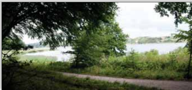
Udsigt ved Ørnedalsbugten

En anden smuk plante, der vidner om, at der har været skov i området i mange år, er storkonval. Den er ligesom sin slægtning liljekonvallen giftig. Dens hvide blomster hænger "til tørre" på rad og række langs den 40-80 cm lange stængel mellem regelmæssigt spredte blade. Blomsterne har ingen duft i modsætning til liljekonvaller, der har en stærk sød blomsterduft. Du kan finde begge konvaller i Hobro Østerskov.